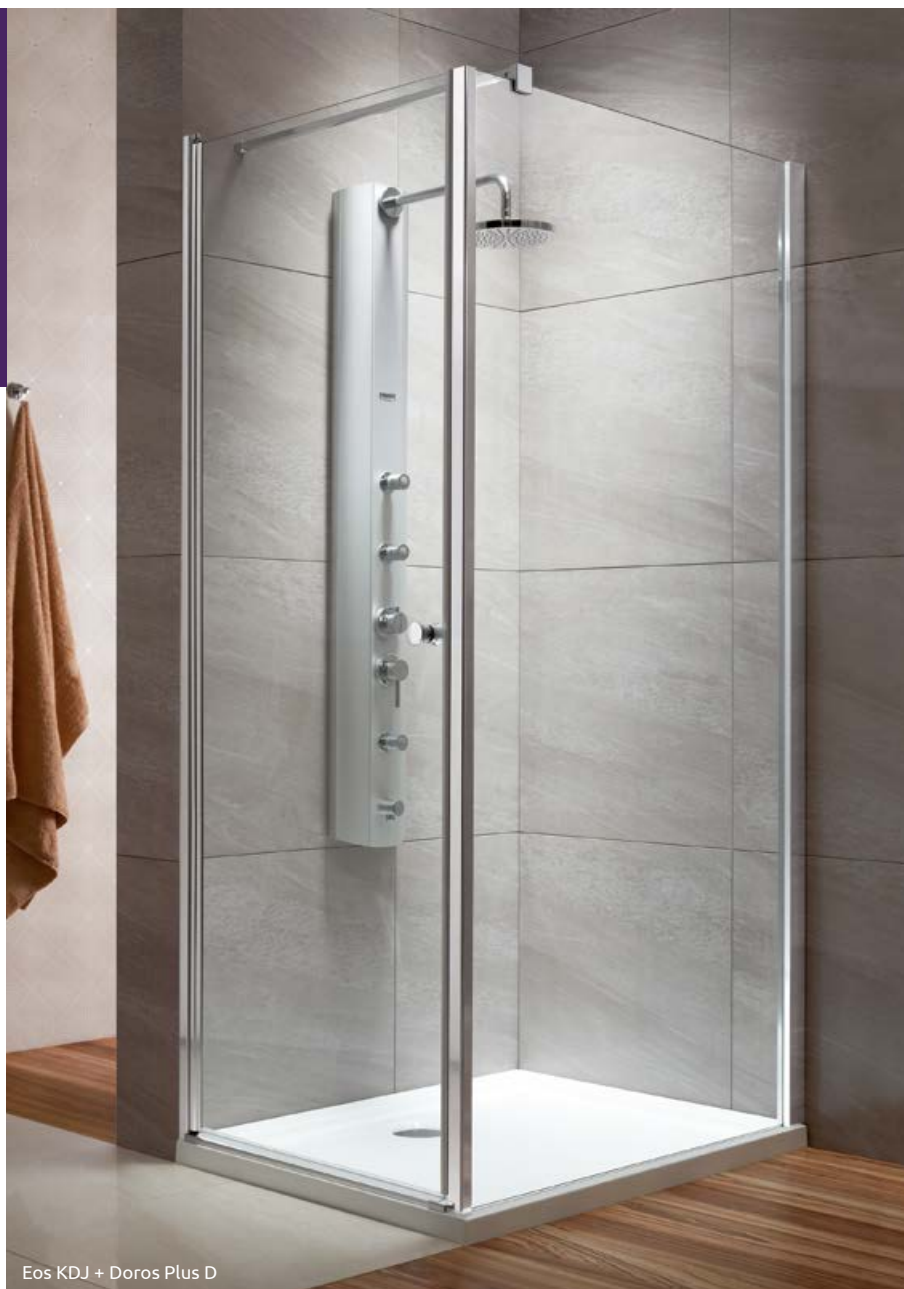
Eos KDJ + Doros Plus D